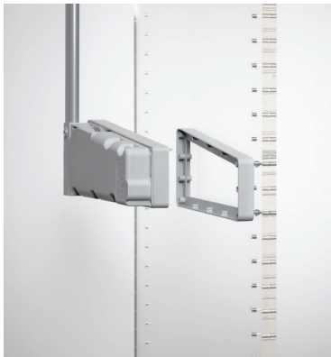
Distanz - 20 mm

Der Lift 300 ist das Einstiegsmodell unserer Kleiderlifte.